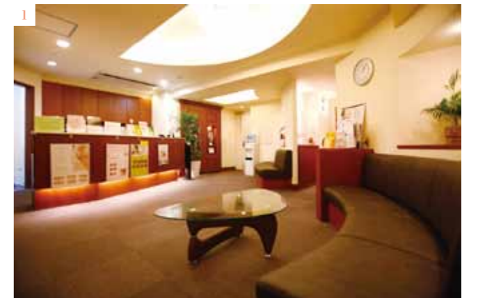
1. ダークブラウンの木目が美しい、ラグジュアリーな雰囲気の待合室 2. 患者の要望を丁寧に聞き取り、最適な治療法を提案

顔全体のアンバランスにつながるばかりでなく、その技術の良し悪しが誰の目にも一見してわかってしまいます。ですから手術に際しては、患者さんとの間で事前の徹底したカウンセリングが欠かせません」と吉川先生。対話を重ね、可能な限り自身と患者双方の仕上りのイメージを近づけていく。病气II保険適用、美容目的II保険外という明快なスタンスで治療にあたる吉川先生だが、保険適用の眼瞼下垂手術であっても、自然な美しさを加味した妥協のない技術で臨むことを決して怠らない。より満足度の高い医療を提供したいという、吉川先生のポリシーがそこにある。